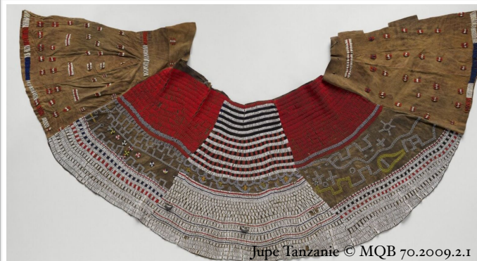
Jupe Tanzanie