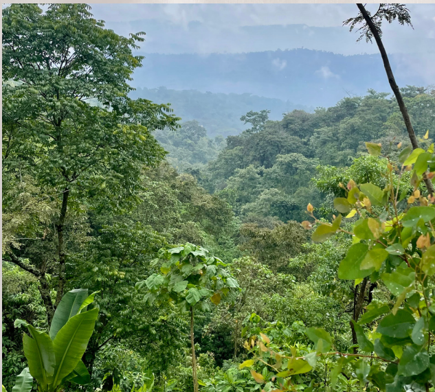
Vue du pays gedeo et de son agroforesterie traditionnelle