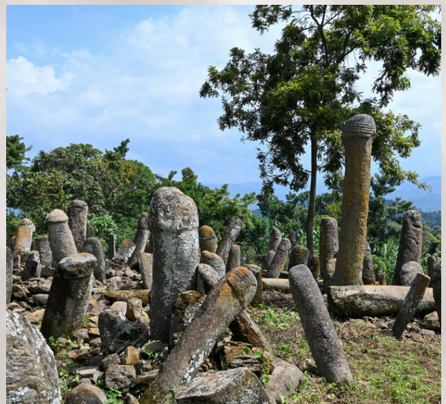
Mission Abaya 2022