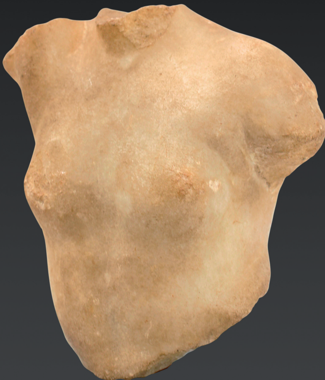
14 Torse de Vénus représenté le bras droit levé. Marbre blanc coloration beige en profondeur. (Lacune et éclat visibles). Hauteur : 17 cm. Art Romain. I er siècle après J.C. On retrouve ce torse posé sur une table avec d'autres objets de la collection dans le film sur le docteur Sempé qui avait été tourné en 1963 (INA du 15.09.63).